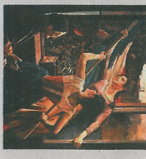
Museo del Risorgimento